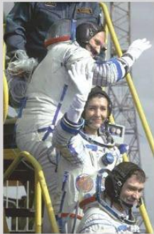
Claudie pendant la mission Andromède

Au total, Claudie a passé plus de 25 jours dans les étoiles.