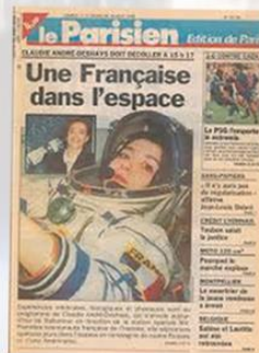
La nouvelle au journal "le Parisien"