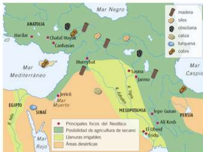
El Creciente Fértil